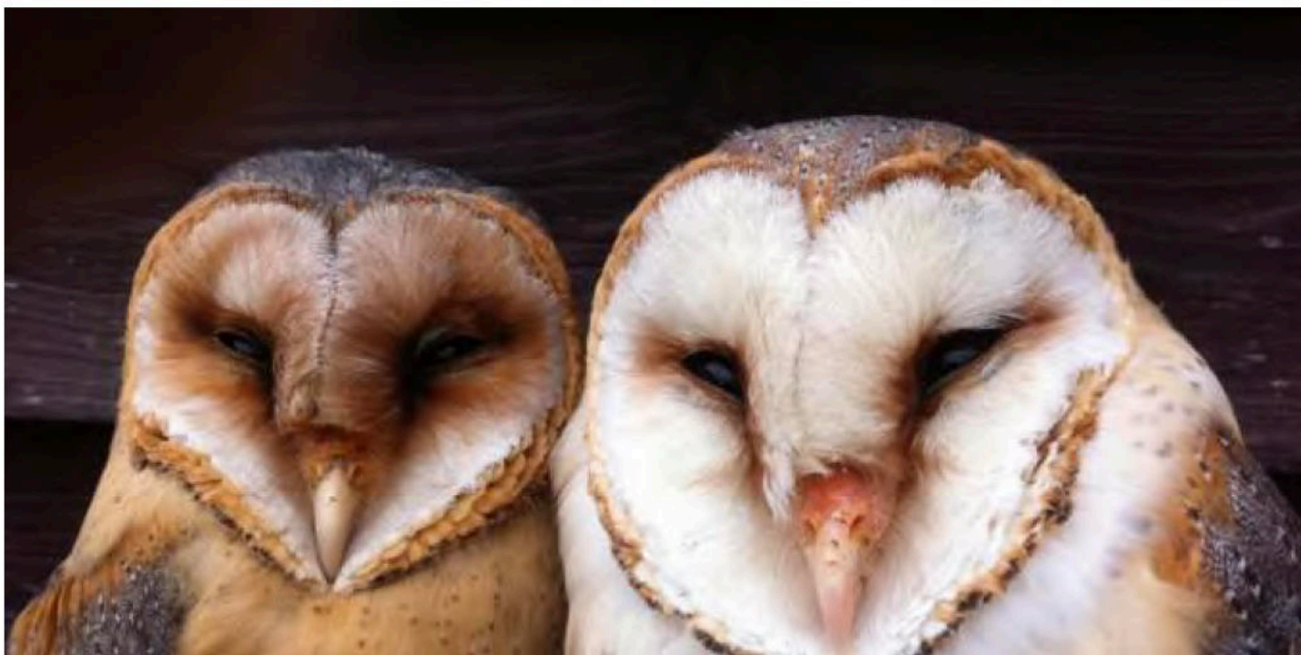
Schleiereulen gibt es mit rötlicher und weisser Gefiederfärbung. In mond hellen Nächten lassen die hellen Eulen

Abgesehen von der Jagd in mond hellen Nächten stellt das weisse Gefieder eher einen Nachteil dar, da es die Aufmerksamkeit unliebsamer Konkurrenten wie Aaskrähen erregt. Dass es unter bestimmten Umständen eben doch Vorteile hat, könnte erklären, warum es verschiedene Farbvarianten bei Schleiereulen gibt und die Evolution nicht nur einer Variante den Vorzug gegeben hat, schreiben die Forschenden.