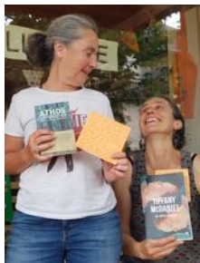
Les libraires de La lanterne qui rugit .

Librairie La lanterne qui rugit , 33, route du plateau 73340 Lescheraines. Du lundi au samedi de 9 à 19 heures. 04.79.88.10.99. lalibrairiequirugit.com