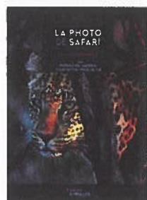
Les secrets de la photo de safari, de Francis Bompard, éd. Eyrolles, 118 pages, 23 €.

Vous appréciez la photographie animalière, avez la chance de partir en safari en Afrique et souhaitez en rapporter de beaux clichés? Ce guide précis et facile d'accès vous fournit les clés de la réussite de la photo animalière. Préparatifs du voyage (modalités, destinations, bagages, etc.), choix du matériel (appareils, optiques, etc.), techniques photographiques (réglage du boîtier, composition des images, jeux de lumière, etc.), connaissance des comportements des animaux, tri et post-traitement des images... Francis Bompard, encadrant chevronné de safaris-photos africains, partage son éthique de la photo animalière et n'est pas avare en anecdotes ou conseils avisés.