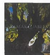
Remarquables – Des arbres, des femmes et des hommes en Ardèche, de Bruno Auboiron (textes), Simon Bugnon, Justine Collomb (photos) et Alice Auboiron (illustrations), éd. Septéditions, 220 pages, 29 €.