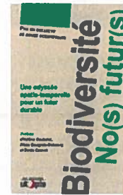
Biodiversité, no(s) futur(es), collectif de douze scientifiques, éd. Utopia, 208 pages, 10 €.

Entre flashbacks historiques et nouvelles d'anticipation,