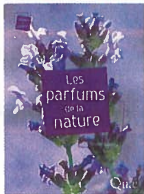
Les parfums de la nature, de Roland Salesse, éd. Quae, 152 pages, 23 €.

Tout commence par une suave balade olfactive au fil des saisons. L'ouvrage devient ensuite plus âpre, en fourrant son nez dans la complexité des messagers chimiques, de leurs récepteurs et, in fine , de la communication chimique chez les animaux et les plantes. Mais le propos est riche, enivrant, et sa vulgarisation réussie. Roland Salesse, ingénieur agronome, spécialiste en biologie moléculaire, décrit avec les mots justes les parfums et odeurs de la nature. Le propos est scientifique mais efficace et didactique.