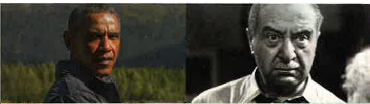
En pleine nature avec Barack Obama