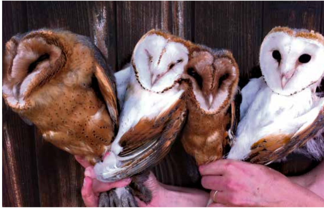
L'application Morphic a permis de placer sur une carte les habitats de milliers de chouettes effraies. (ALEXANDRE ROULIN)

L'étude a porté sur quatre espèces polymorphiques pour lesquelles des données scientifiques précises concernant leur distribution géographique existent déjà (ours, corneille, chouette effraie et épervier). Les chercheurs ont été capables d'établir cette même distribution géographique mais en utilisant uniquement les données disponibles sur Google Images. Plus de 4800 images ont été passées en revue.