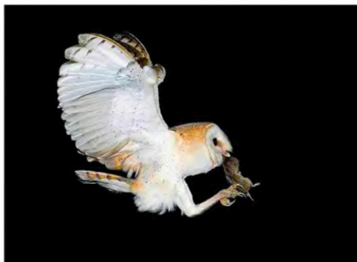
Eine Schleiereule jagt aufgrund ihrer speziellen Flügel lautlos.